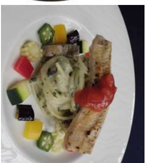
『クレソンとうなぎのクリームパスタ 夏野菜と白焼きのあぶり添え』