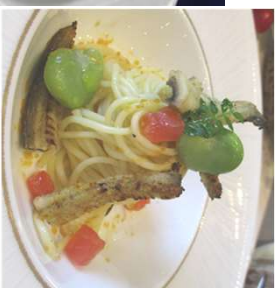
『白焼き鰻のパスタ』