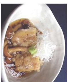
『うなぎ白焼の粒そばなめこ あん白髪ねぎわさび添え』