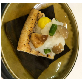
『うなぎ白焼きかぶら蒸し』