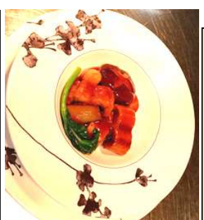
『白焼きうなぎ広東風醤油煮』