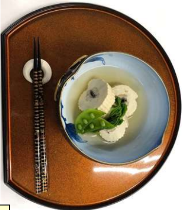
『白焼きうなぎ豆腐』