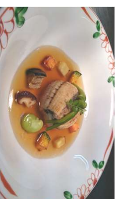
『白焼きうなぎの飯蒸し』