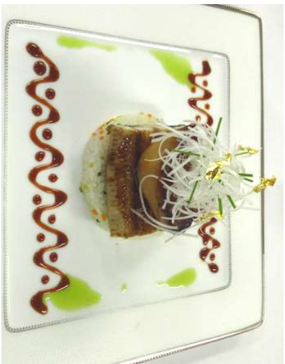
『温泉ウインナギとフナアグラの和風仕立て 山梨県産ウインビネガーを使ったソース』