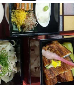
『温泉ウインナギの甲州赤ウイン煮込み 赤みそ風味』