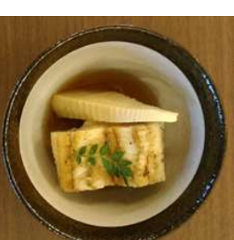
『白焼き鰻竹の子煮物』