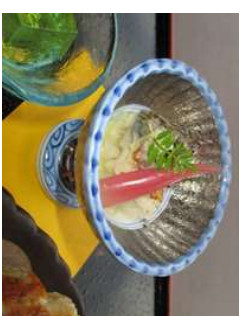
『白焼き鰻養老寄せ』