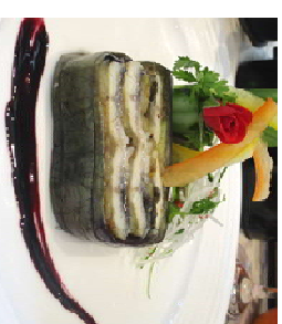
『鰻と茄子のネリソース』