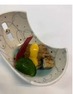
『うなぎ白焼きの酢の物』