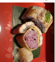
『白焼き鰻果米寿司』