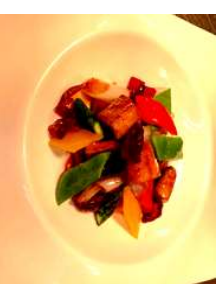
『白焼きピリ辛黒酢炒め』